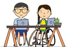
Enfoque de inclusión