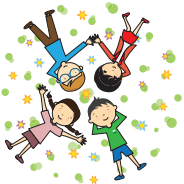
Enfoque de derechos