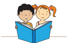
Enfoque de género