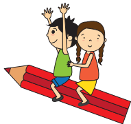
Enfoque de desarrollo integral