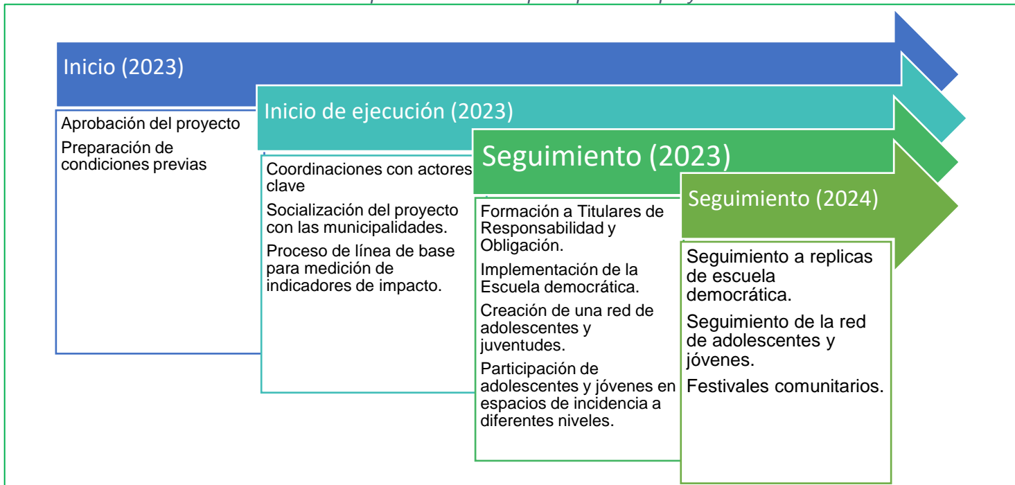
Ilustración 2. Línea de tiempo de actividades principales del proyecto SV2220